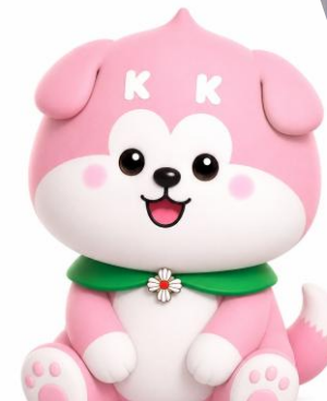
◁甲府地検マスコットキャラクター