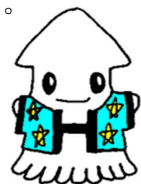
函館地方検察庁広報キャラクター「はっぴー」

検察事務官になるためには、国家公務員試験の一般職試験(大卒程度試験、高卒程度試験、社会人試験)に合格することが必要です。