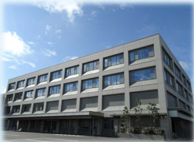
山形地方検察庁の庁舎です

出身学部は問いません！ 理系の方の参加も大歓迎です！ 検察庁や法律のことに少しでも興味がある方、 山形地検の業務説明会にぜひご参加ください♪