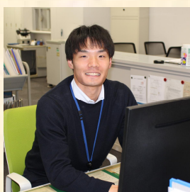
事務局部門/採用5年目

法律系学部出身以外の職員もいて、意欲と向上心があれば、検察事務官として十分に活躍していけますので、その点は安心していいと思います！