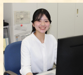
捜査公判部門/採用2年目

検察官と一緒に事件の捜査をする検察事務官は、非常に専門性が高く、事件の真相解明を目指すやりがいのある仕事です。