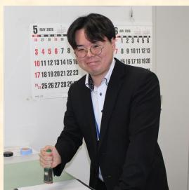
検務部門/採用8年目