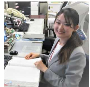
（検務官室所属・令和7年採用）

私は現在、 検務部門 で事件・令状担当として勤務しています。 主に、警察から検察庁に送られてきた 事件の受理手続 や検察官が捜査をした事件の 処理手続 、 令状を裁判所に請求する事務 などを行っています。 責任の重い業務ではありますが、その分 様々な知識を身につけることができ、やりがいを感じています。 また、業務で分からないことがあった時には、 上司や周りの方が親身になって教えてくださるため、安心して業務に取り組んでいます。 検察庁に少しでも興味のある方は、是非、 業務説明会にお越しください！！