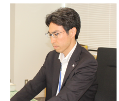
任官5年目 男性副検事