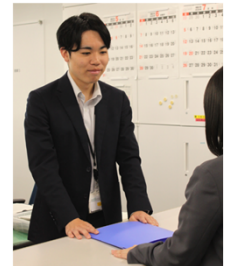
採用2年目 男性事務官

日々、様々な事件を取り扱い、警察、検察庁、裁判所それぞれの「架け橋」となる要の仕事ですが、上司や先輩に助けをもらいながら、日々の業務に励んでいます。