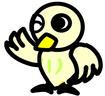
さいたま地検広報キャラクター