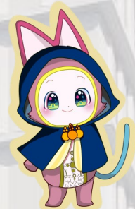
法務省広報(ほうむSHOW編集局) 公式マスコットキャラクター「ももちゃん」