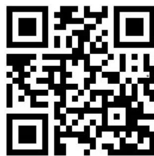
予約メール用QRコード