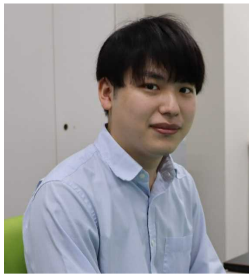
(立会担当・ 山口県立山口高校平成30年卒)

検事になるためには、司法試験に合格した後、司法修習を終え、法務省が行う面接に合格すれば検事に任官できます。