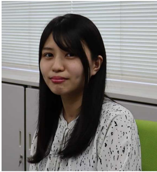
(山口地検検事・ 山形県立鶴岡南高校平成28年卒)