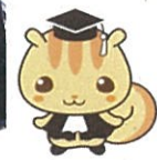
法教育マスコットキャラクター「ホウリス君」