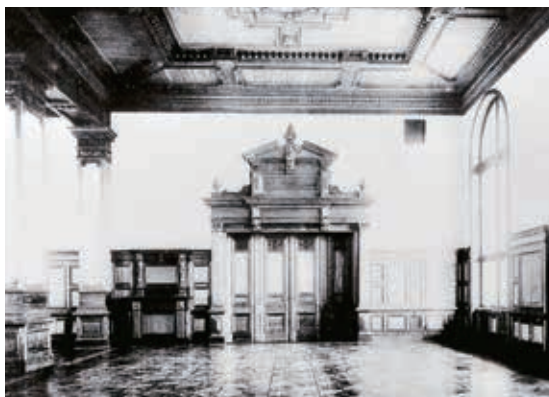
旧司法大臣官舎大食堂

明治政府によって策定された官庁集中計画の一環として建てられた建物のうち残存する唯一のものであり、我が国の建築の近代化を象徴する文化遺産となっている赤れんが棟の創設に関する史料、赤れんが棟に使われた建築技術の史料、赤れんが棟の改修・復原事業に関する史料などを展示しています。