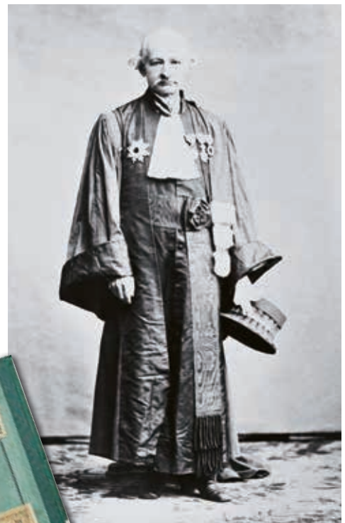
フランス人法律家ボアソナードと 旧日本刑法草案