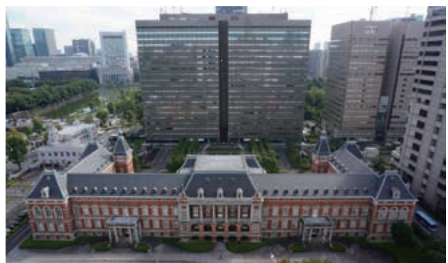
赤れんが棟と中央合同庁舎第6号館A棟